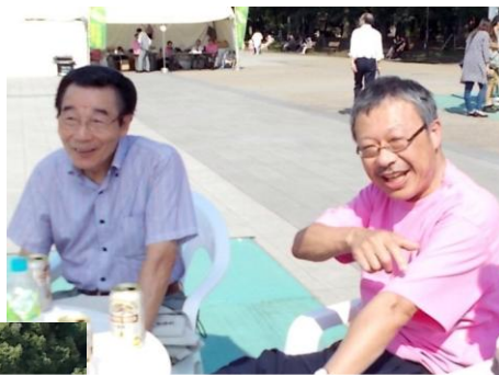
府中南支部、前支部長・現支部長 ビールをはさんで大いに語る!?