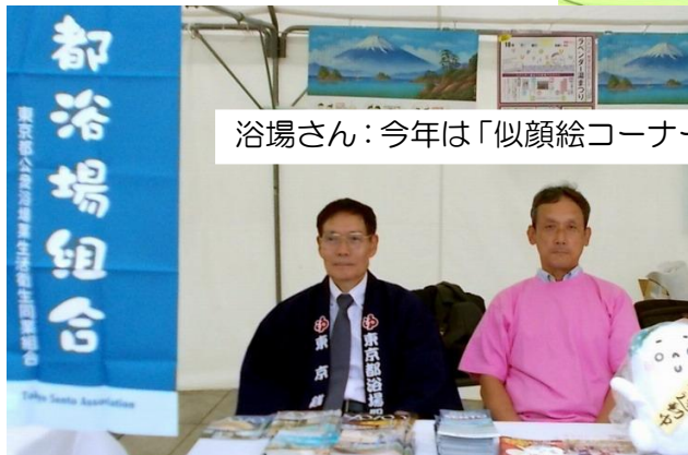
浴場さん: 今年「似顔絵コーナー」