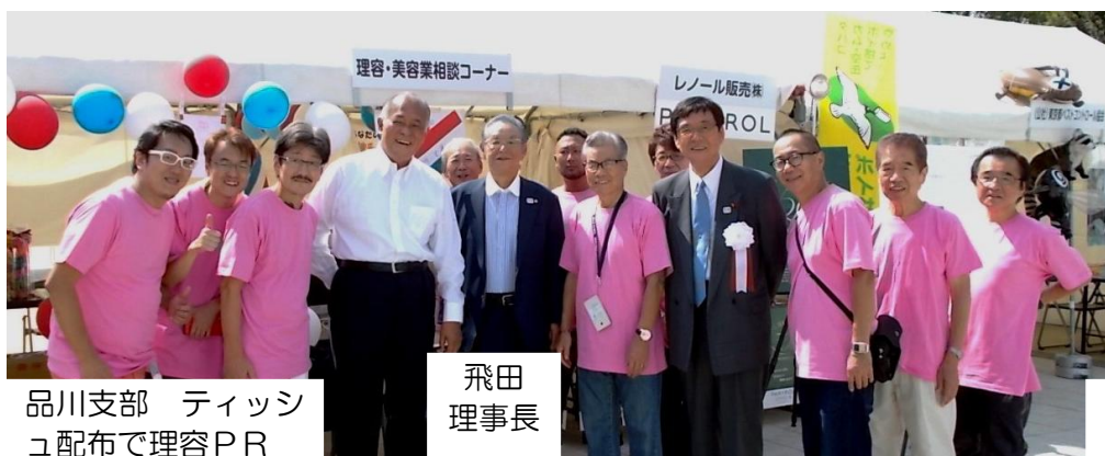
品川支部 ティッシュ 配布で理容PR