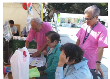
墨田支部: 顕微鏡で毛穴チェック